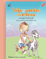
ไปนุ้ยกับแพะน้อยในวันฮารีรายอ