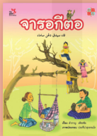
จารอเก็ดตอ