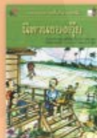
นิทานของอู๋