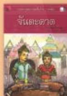
จันตะคาด