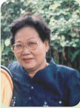
เค้าโครงเรื่อง