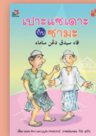
เปาะแซเตาะกับซามะ