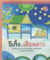
อีเก้ง...เดือนดาว