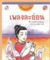
เพลงละอ่อน