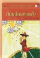
อ้อมล้อม ทองคำ