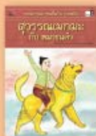
สุวรรณเมฆะ กับ หมาขนดำ