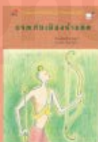
ผจญภัยเมือง ฟ้าแดด