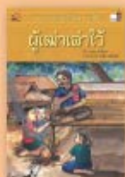
ผู้เฒ่าเล่าไว้