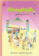
เมืองน่าอยู่ที่หนูรัก