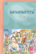
แดนคนธรรพ์