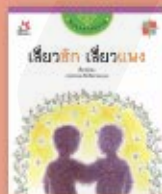
เสียวฮักเสียวแพง