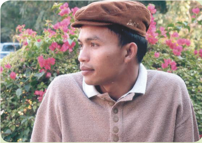
ผู้เขียนภาพประกอบ