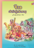
ซิง : เจ้าป่าผู้กล้าหาญ