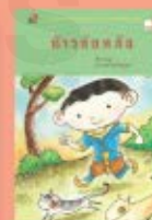
ท้าวซ้อหล้อ