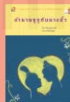
ด่านนาง งูกับนางอ้ว