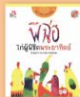
พี่จ้อ...โกผู้พิชิต พระอาทิตย์