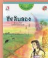
ฮีตสิบสอง