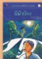
ผีน้ำบอง