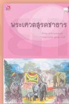
พระเศวตสุรคชาธาร