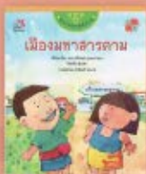
เมืองมหาสารคาม