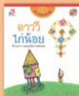
ดาววิโก้