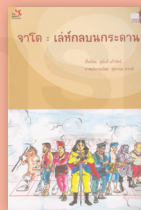
จาโต : เล่ห์กลบนกระดาน