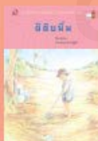
ผีดิบพัน