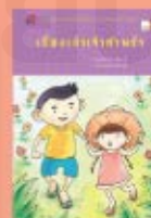
เรื่องเล่า เจ้ากำพ้อ