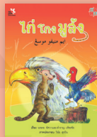
ไก่โงมูสัง