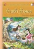
กำฟ้าบัวทอง