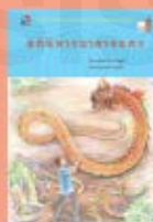
อภินิหาร บาดาลนคร