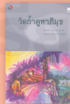
วัดถ้ำคูหาภิมุข