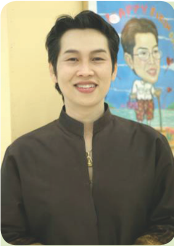
ผู้ร้อยเรียง