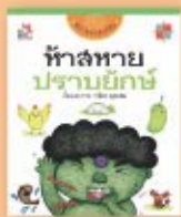
ทำลายปราบยักษ์