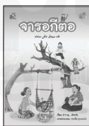
จารอเกีตอ