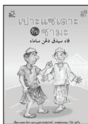
เปาะแซเดาะกับซามะ