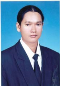
ภาพประกอบ : วินัย สุขวิน