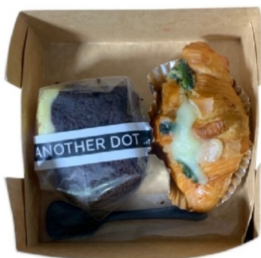
Set D 90 บาท เบเกอรี่ 2 ชิ้น + น้ำเปล่า