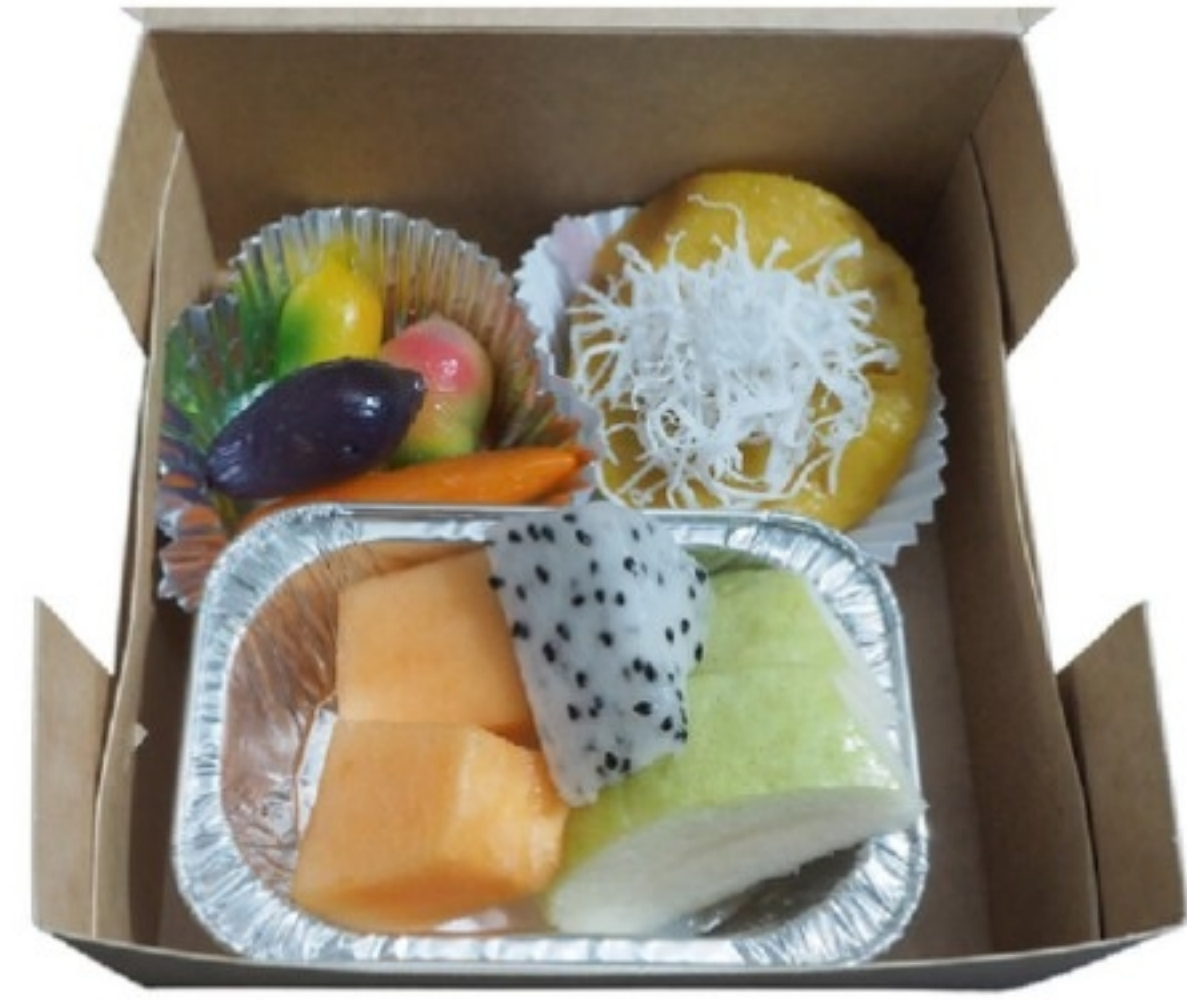
Set A 70 บาท