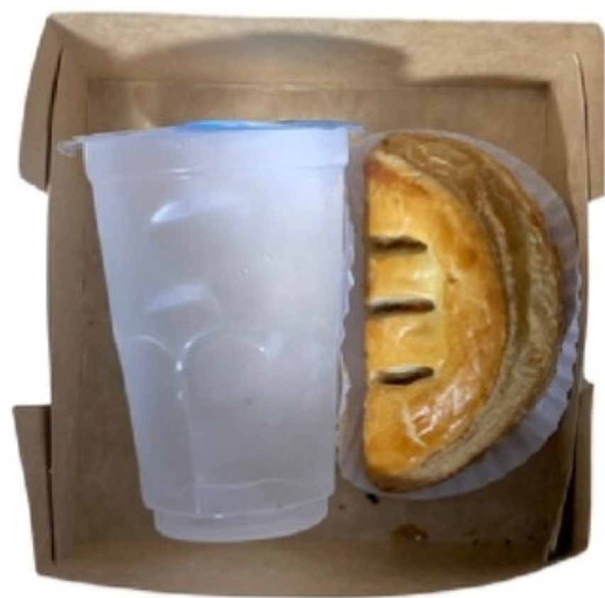
Set D 55 บาท เบเกอรี่ 1 ชิ้น + น้ำเปล่า