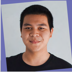
อิสริยะ น้อยนอนเมือง