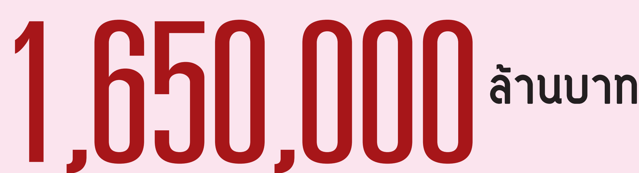
ที่มา : CEIC รวบรวมโดยศูนย์วิจัยกิจการไทย (Balance of Payment Basis). (ข้อมูลปี พ.ศ. 2556)

ขีดความสามารถในการแข่งขัน เป็นอันดับที่ 1