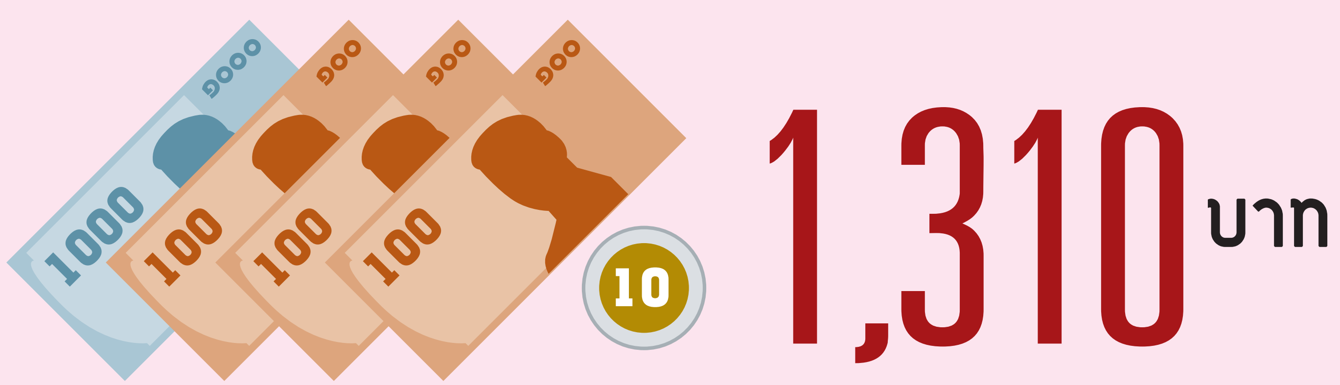
ที่มา : "AEC Plus", ศูนย์วิจัยกิจการไทย, 2557. (ข้อมูลปี พ.ศ. 2556)