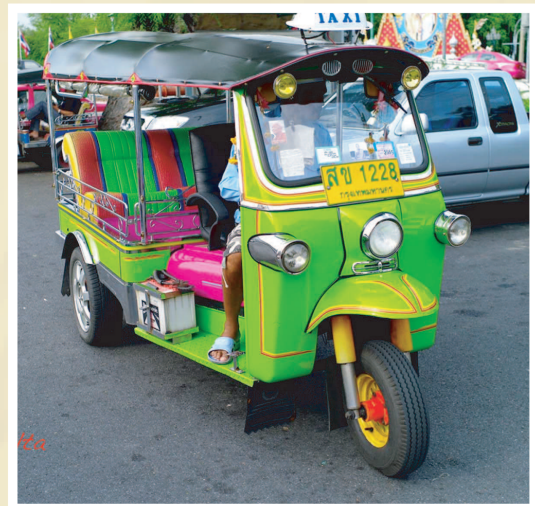
รถตุ๊กตุ๊ก

มีชื่อเรียกอย่างเป็นทางการว่า "รถสามล้อเครื่อง" มีที่มาจากชาวต่างชาติที่มาเที่ยวเมืองไทย ไม่รู้จะเรียกรถสามล้อเครื่องว่าอะไร เลยอาศัยเรียกชื่อตามเสียงท่อไอเสียของรถ จึงกลายเป็นชื่อ "รถตุ๊กตุ๊ก" ติดปากกันมาจนถึงปัจจุบัน และยังเป็นเอกลักษณ์โดดเด่น ที่ช่วยส่งเสริมการท่องเที่ยวของไทยอีกด้วย