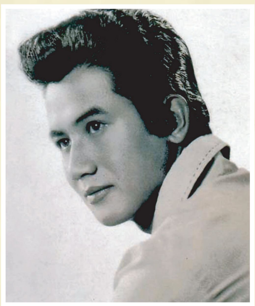
สมบัติ เมทะนี

เป็นแสตมป์ชุดเดียวที่ไม่มีภาษาต่างประเทศ แม้แต่เลขอารบิก บนดวงแสตมป์ และเป็นชุดเดียวของประเทศไทยอีกเช่นกัน ที่ใช้หน่วยเงินไทยโบราณโดย 1 ชุดประกอบด้วย หนึ่งโสฬส, หนึ่งอัฐ, หนึ่งเสี้ยว, ซีกหนึ่ง, สลึงหนึ่ง และเฟื้องหนึ่ง