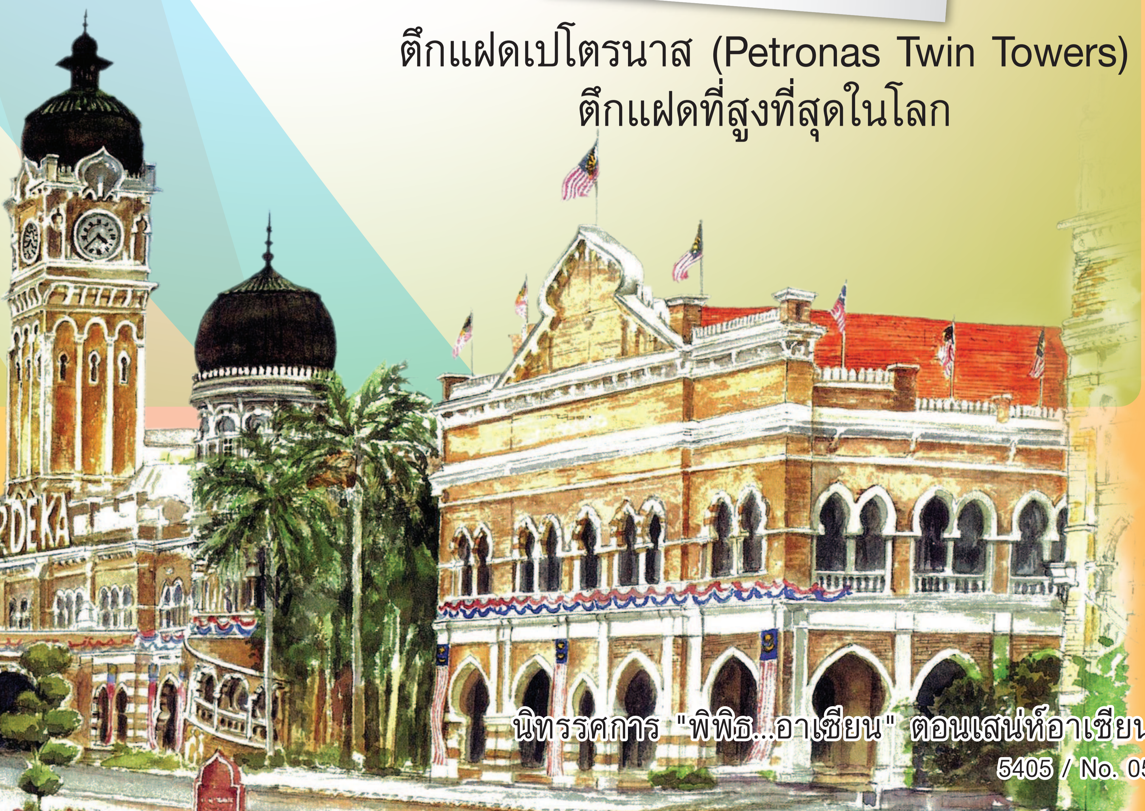
ตึกสุลต่าน अबดุล ซามัด (Sultan Abdul Samad Building in Kuala Lumpur)

นิทรรศการ "พีพีอี...อาเซียน" ตอนเสน่ห์อาเซียน 5405 / No. 05