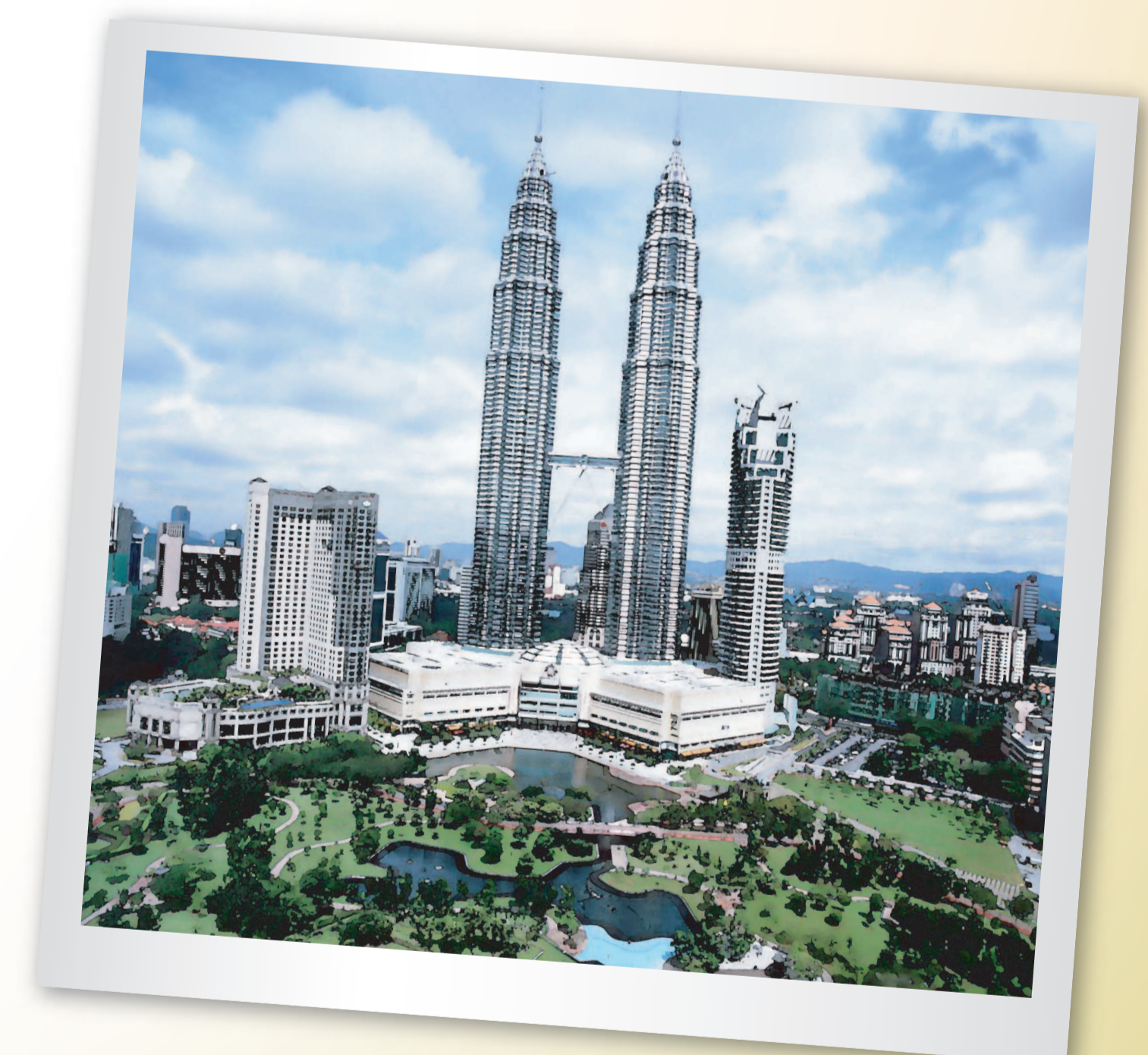
ตึกแฝดเปโตรนาส (Petronas Twin Towers) ตึกแฝดที่สูงที่สุดในโลก