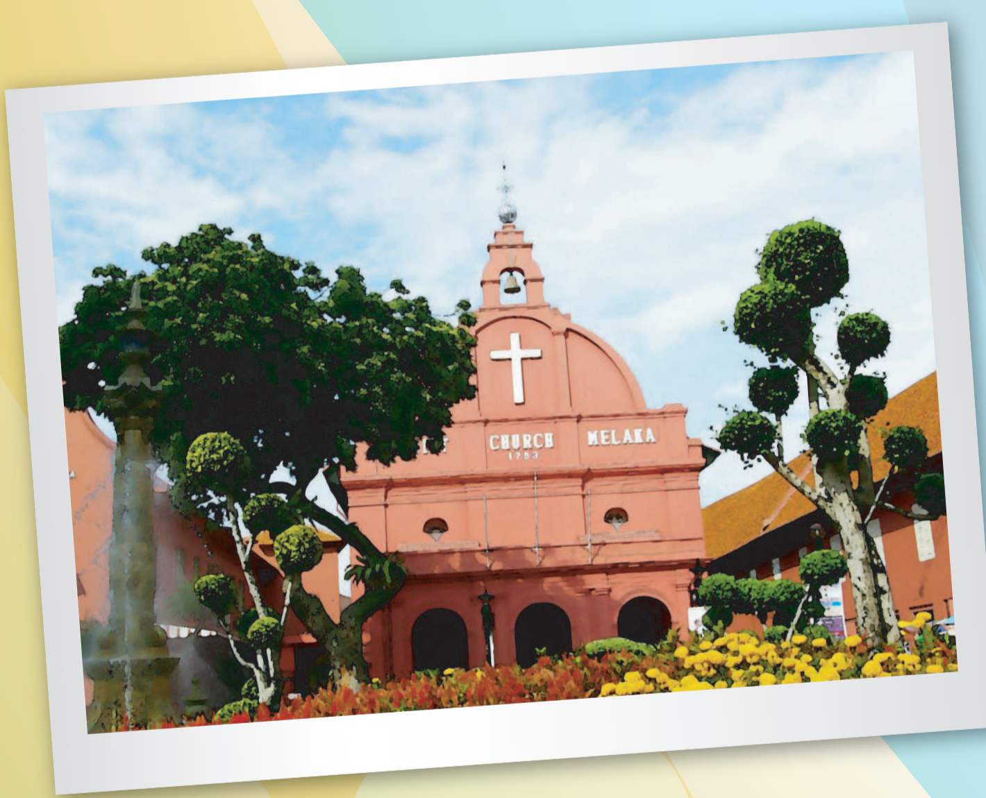
มะละกา (Christ Church Melaka World Heritage City) เมืองมรดกโลก