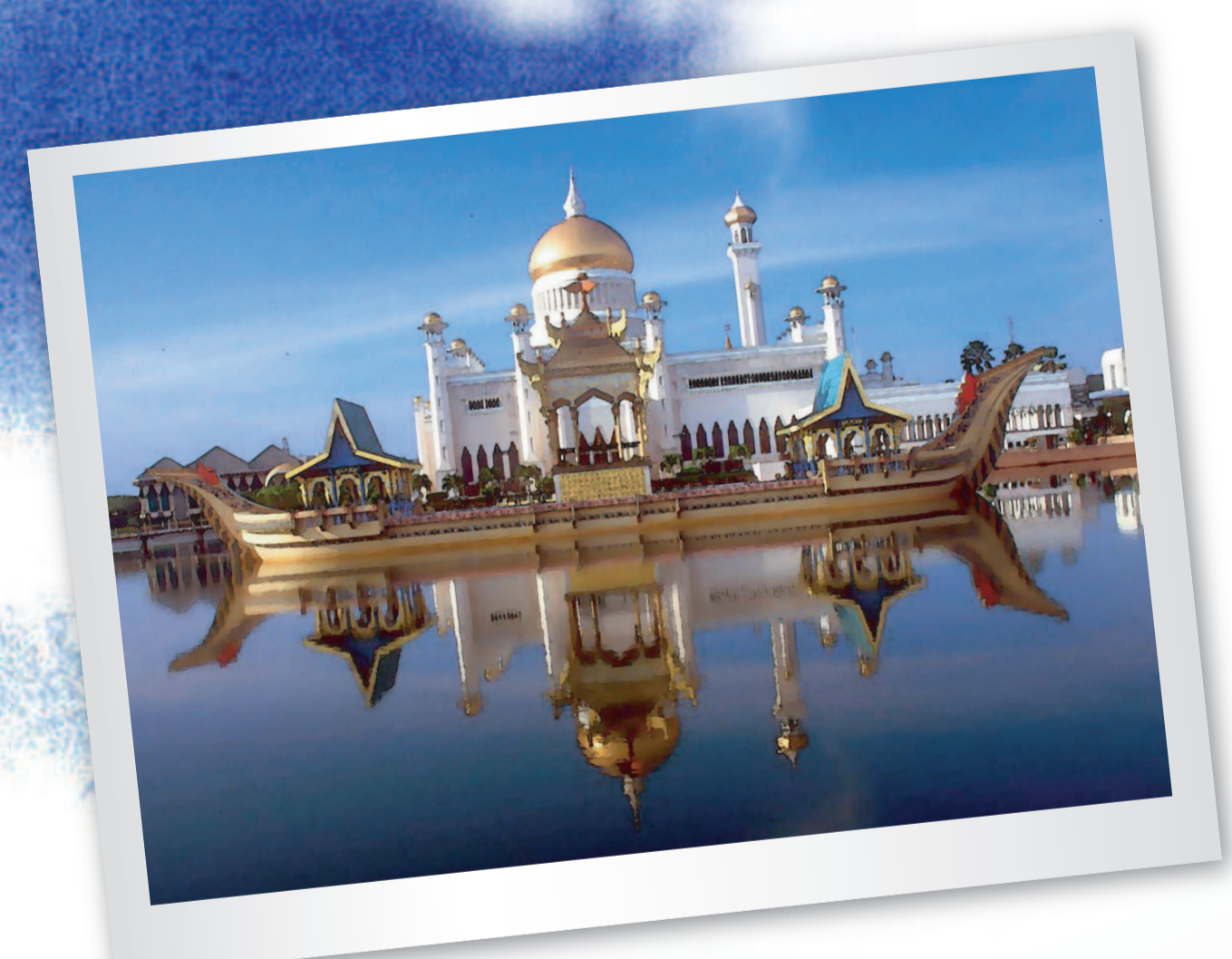
มัสยิดสุลต่านโอมาร์ อาลี ซาฟุดดีน (Sultan Omar Ali Saifuddien Mosque)